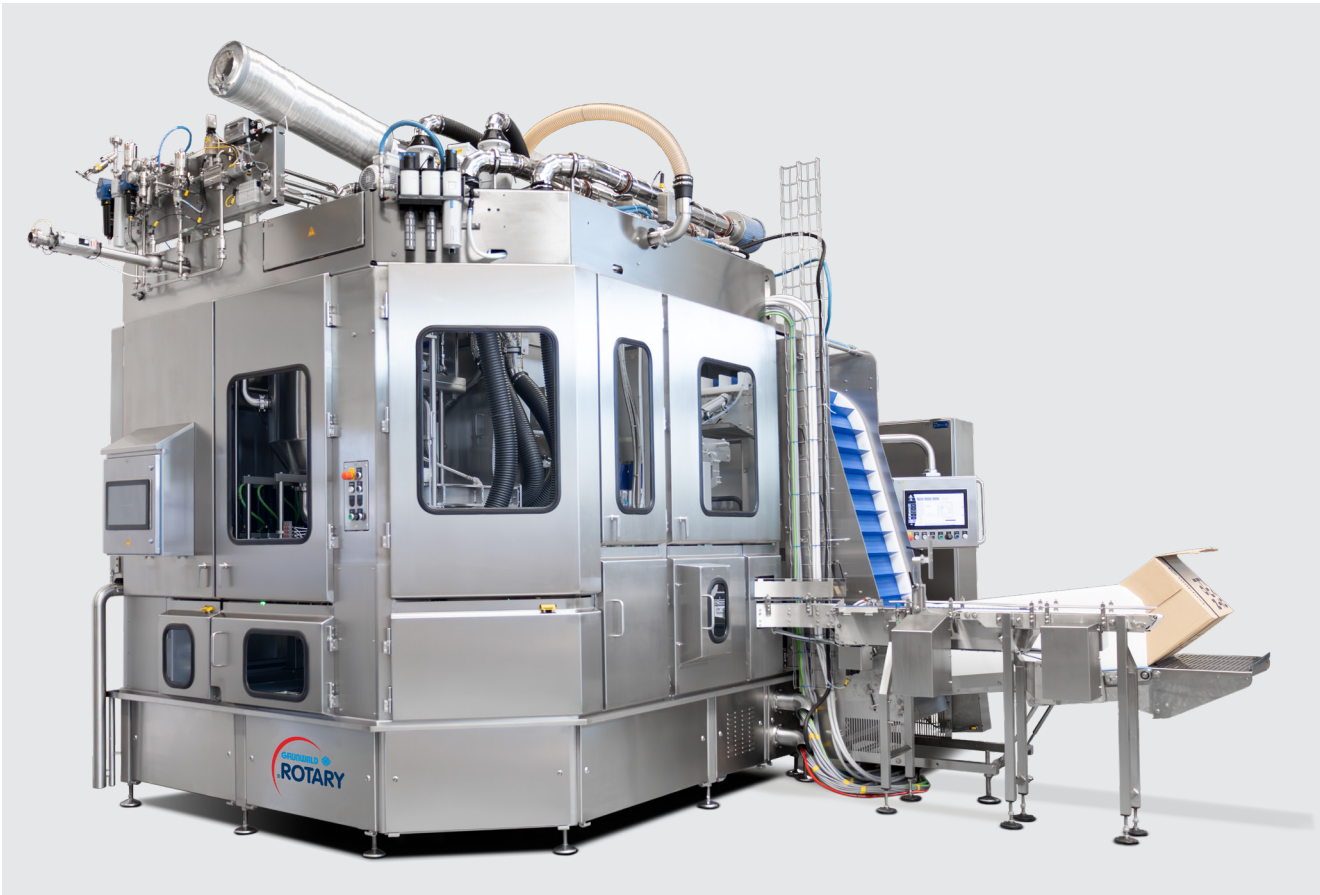
4-bahnige Rundläuferanlage GRUNWALD-ROTARY 20.000E-UC