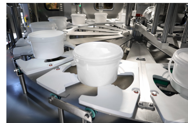
Blick in den Eimerfüller GRUNWALD-ROTARY XXL-UC/1

Das Hygienekonzept erfüllt höchste Anforderungen. Eine Laminarhaube sorgt für Reinluftbedingungen