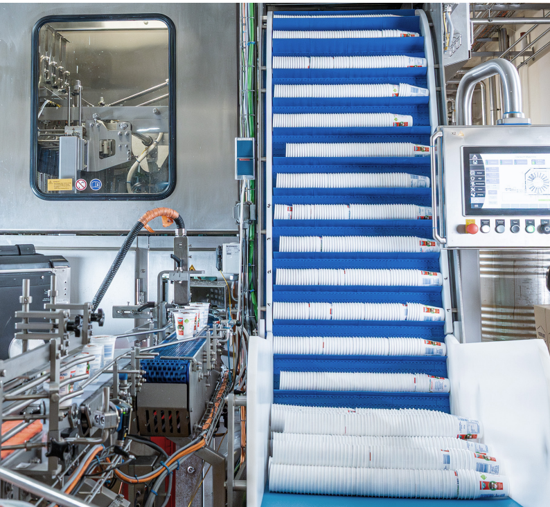
Ansicht des bedienerfreundlichen Low-Level-Bevorratungssystems