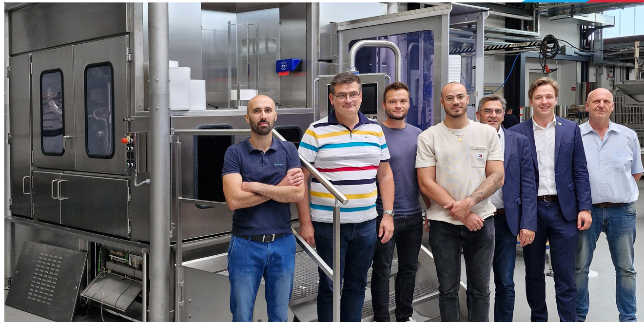
Erinnerungsfoto nach der Maschinenabnahme mit den Projekt-Verantwortlichen von Alsace Lait, unseren Kollegen von GRUNWALD-France und den am Projekt beteiligten Mitarbeitern von GRUNWALD.

Alsace Lait setzt auf GRUNWALD-Technologie für mehr Flexibilität und höchste Hygienestandards